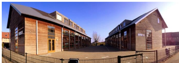
Locatie de Boomgaarden