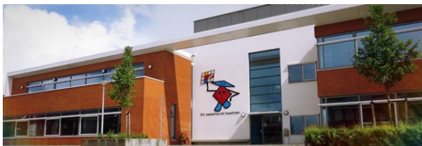
Locatie de Tuinlanden

directeur het management team. De teamleider is verantwoordelijk voor zaken die het onderwijs en de organisatie betreffen. Voor ouders is de teamleider het eerste aanspreekpunt na de leerkracht.