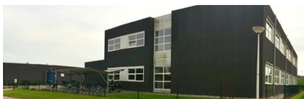
Locatie het Balkon

Op locatie de Boomgaarden / het Balkon werken de teamleiders: